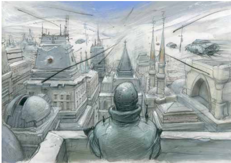
32 Décembre , Planche 57, case 2, 2003 Collection particulière