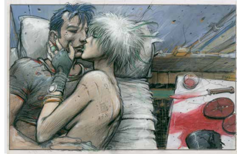
Le Sommeil du Monstre , Planche 18, case 1, 1998 Collection particulière