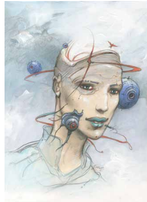
Voyage au cœur de l'Intelligence Artificielle , 2017 Dessin pour la couverture de ce hors-série du journal Libération Collection particulière