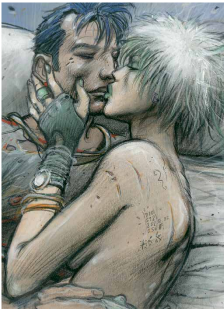
Le Sommeil du Monstre, Planche 18, case 1, 1998 (détail) Collection particulière