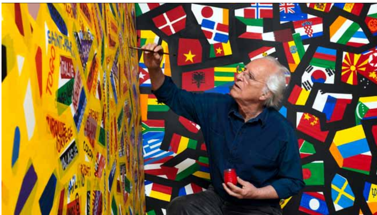
Gérard Fromanger, atelier, Paris, 2012