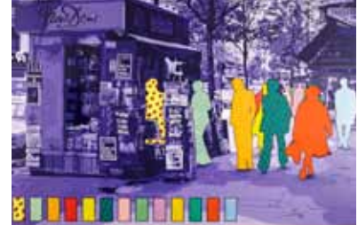
Quel est le fond de votre pensée?, 1973

Série Annoncez la couleur huile sur toile, 200 x 300 cm