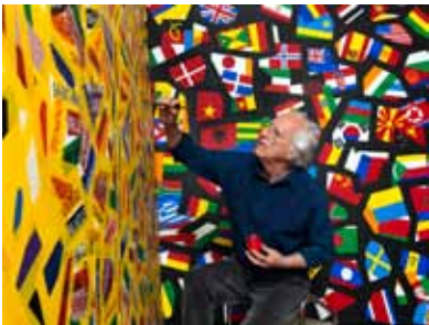
Gérard Fromanger, atelier, Paris, 2012