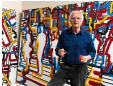
Gérard Fromanger, atelier, Paris, 2012