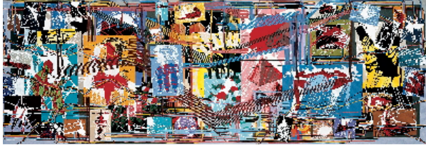
De toutes les couleurs, peinture d'histoire , 1991-92

Série Quadrichromies huile sur toile, 320 x 920 cm