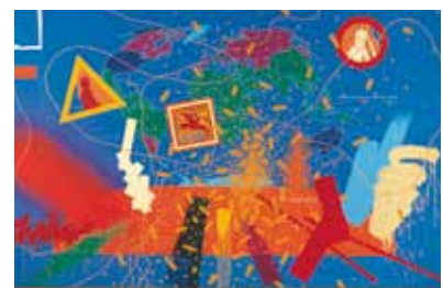
À mon seul désir, 1979

huile sur toile, 130 x 97 cm collection de l'artiste