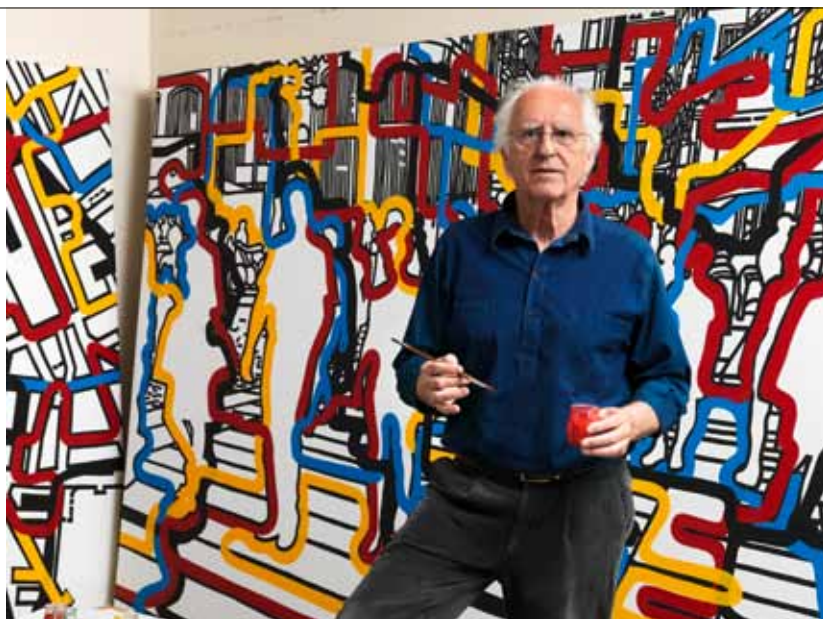
Gérard Fromanger, atelier, Paris, 2012

Né en 1939 à Pontchartrain dans les Yvelines, Gérard Fromanger est l'un des artistes majeurs de la Figuration Narrative en France. Il est soutenu très tôt par la galerie Aimé Maeght, puis par la galerie Jeanne Bucher à partir de 1973. Protagoniste de l'atelier populaire des Beaux-Arts en 1968, il s'engage alors autour des thèmes associant l'art à la liberté, tandis que son œuvre se veut le reflet du monde qui l'entoure. Premier prix de la Biennale de gravure à Tokyo en 1970, son œuvre a fait l'objet de nombreuses expositions en France et dans le monde : musées des Beaux-arts de Dole et de Lons-le-Saunier, Villa Tamaris, Centre d'art de la Seyne-sur-Mer, Musée national