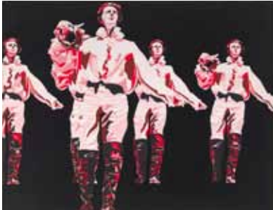
Le rouge et le noir dans le prince de Hombourg, 1965