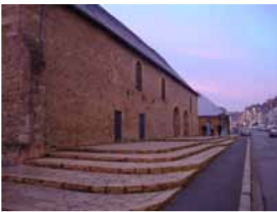
Couvent des Capucins, Landerneau