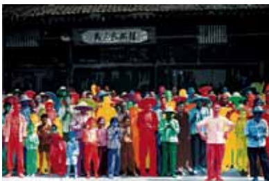
En Chine à Hu-Xian, 1974

Centre national des arts plastiques, dépôt du Musée des beaux-arts de Dole © Gérard Fromanger/ CNAP/ photo: Pierre Guénat, Dole