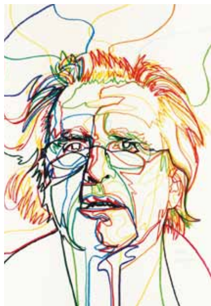
Gérard (autoportrait), 2011 Série Splendeur IV, Dérives portraits dessins 1982-2002 pastel sur papier 56 x 76,5 cm

Les Salons de Mai en 1964 et 1965, ainsi qu'une exposition collective à la galerie Aimé Maeght révélèrent Gérard Fromanger au grand public, tandis que la série Le tableau en question souligne son ex-