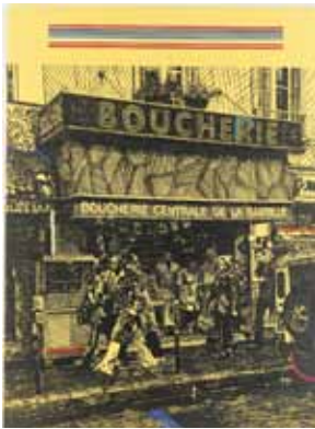
Méfiez-vous fillettes , 2002

Série Série noire huile et acrylique sur toile, 130 x 97 cm