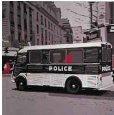
Le rouge, 1971

collection Musée national d'histoire et d'art du Grand-Duché, Luxembourg © MNHA/Tom Lucas