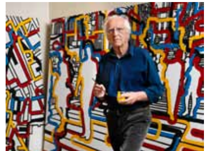
Gérard Fromanger, atelier, Paris, 2012