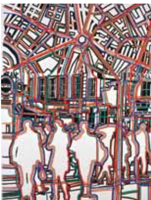
Bastille - connexion , 2007

collections privées et collection de l'artiste