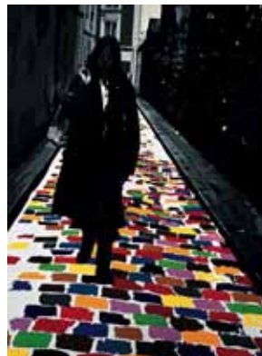
Florence, rue d'Orchamp, 1975

Centre Pompidou, Paris Musée national d'art moderne/ Centre de création industrielle © Centre Pompidou, MNAM-CCI, Dist RMN/ Philippe Migeat