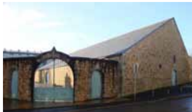
Couvent des Capucins, Landerneau