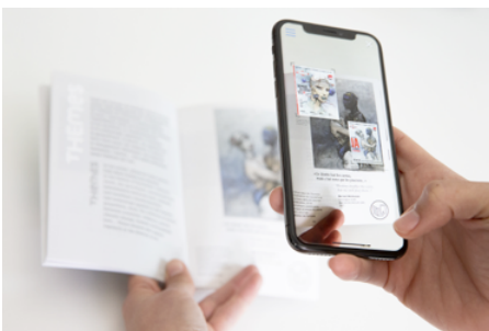
Image connectée

Autant de contenus accessibles sur le site internet et les réseaux sociaux du FHEL : une offre de médiation digitalisée disponible pour nos publics.