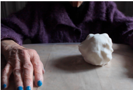
Venus Anatomica © Judith Deschamps

— Présages par Hicham Berrada, en collaboration avec Laurent Durupt